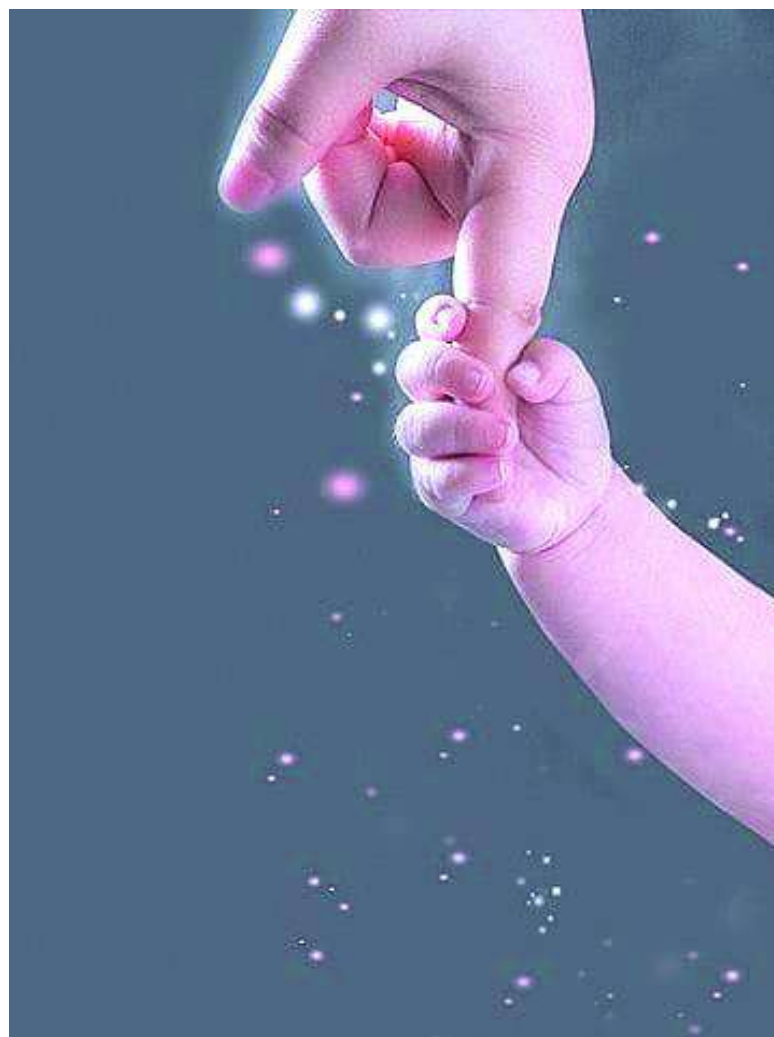
‘కరమ్ చంద్’ ఉన్నాడు.

గృహ వ్యవహారాల్లో తల్లి పాత్ర కీలకం. అయితే లోక వ్యవహారంలో తండ్రిదే ప్రధాన భూమిక. తండ్రి వంశమే కుమారుడికి వస్తుంది. క్రమశిక్షణ, నీతి, నిజాయతీ లాంటివన్నీ పిల్లలకు నేర్పుతాడు తండ్రి. నాన్న వేలు పట్టుకునే బిడ్డ లోకాన్ని చూస్తాడు. దాశరథి, మారుతి, జానకి, ద్రౌపది, కైక ఇలా ఇతిహాసాల్లో తండ్రి పేరుతోనే బిడ్డలు విఖ్యాతులవటం తెలిసిందే. ఉత్తరాదిన పేరు చివర తండ్రి నామం కూడా వస్తుంది. భారత జాతిపిత ‘మోహన్ దాస్ కరమ్ చంద్ గాంధీ’ పేరులో తండ్రి